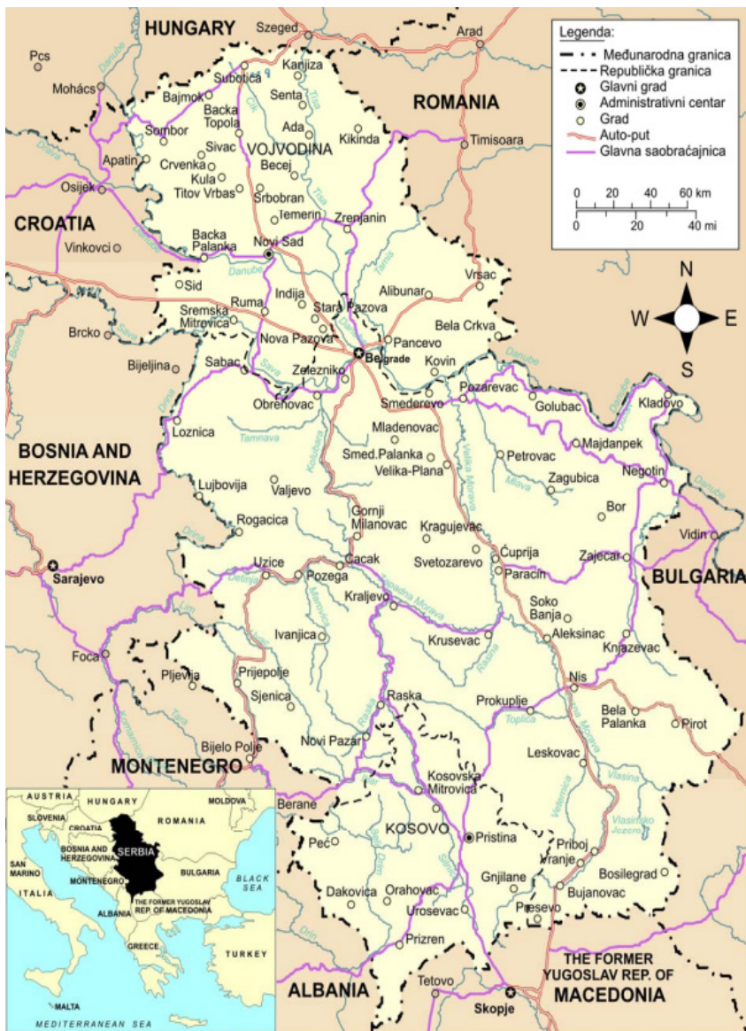
Slika 3. Geografski pregled teritorije Srbije sa većim gradovima i naseljima

izvode ili neusaglašene proizvode nakon plasiranja na tržišta (Josimović & Adamović, 2017).