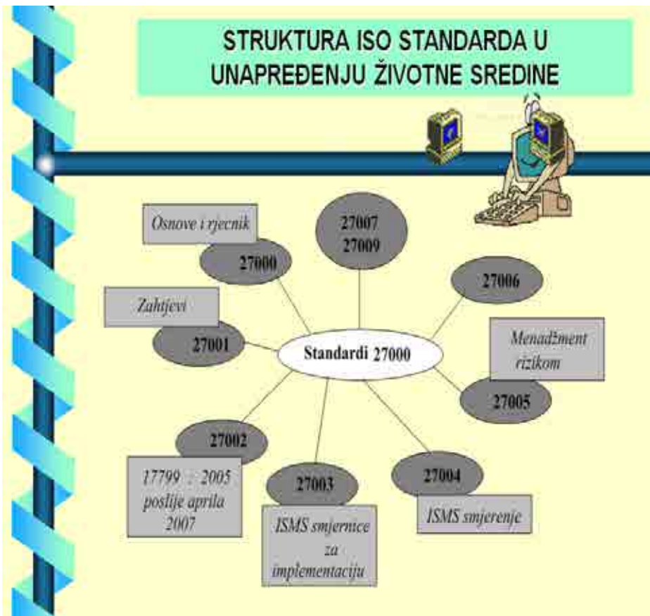
Slika 6. Standardi ISO 27000 koji daju smernice u uslovima eko-rizika