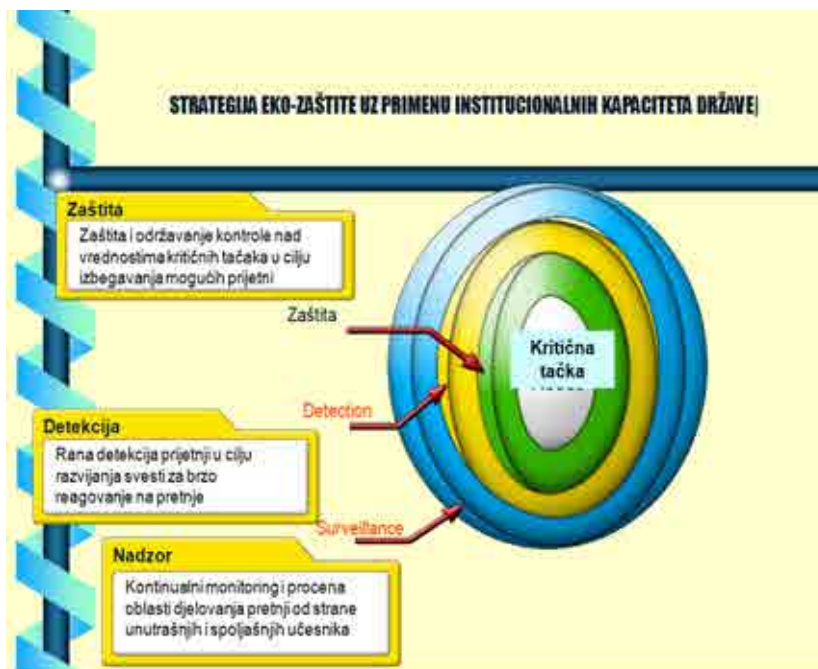
Slika 2. Organizacioni sadržaji i mere eko-bezbednosti

Poseban problem u Srbiji je reciklaža građevinskog materijala. Otpad od rušenja i građenja su jedan od najobimnijih i najtežih tokova otpada.