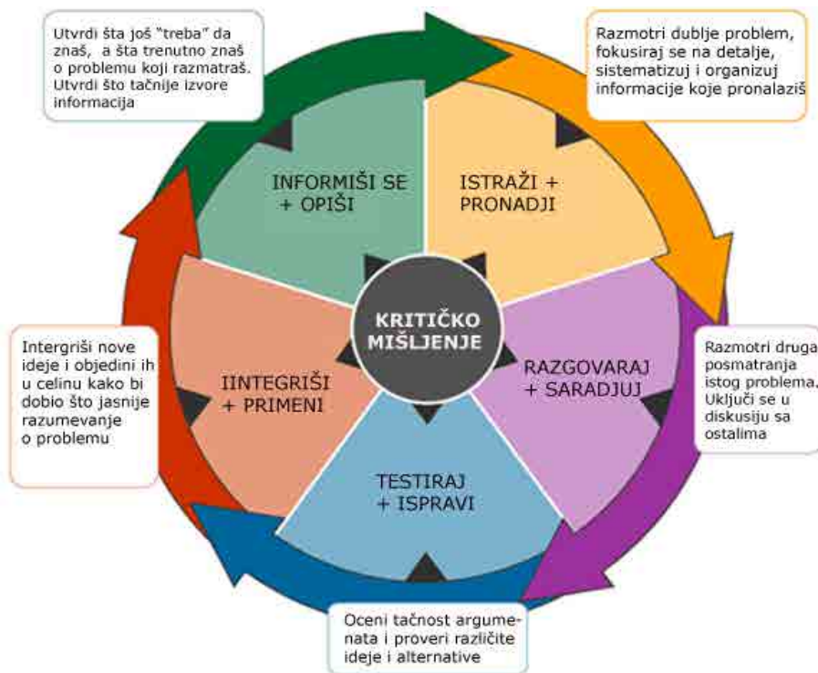
Slika 5. Kritičko mišljenje i kompromis u postizanju ciljeva eko-standarda

U ovom poglavlju rada je prikazana analiza aktuelnih pitanja koja stoje kao svojevrsna prepreka zemljama Zapadnog Balkana na putu ka dobijanju punopravnog članstva u EU. Pitanje ustavnih reformi, te institucionalnih kapaciteta u ovom trenutku jesu svakako jedna od najvažnijih pitanja na tom putu. Naša država ukoliko želi dobiti status kandidata treba novi, evropski ustavnopravni identitet, te funkcionalnije institucije većih administrativnostručnih i infrastrukturnih kapaciteta neophodnih prije svega za složeni proces harmoniziranja sa pravnom stečevinom. Ističući osnovne premise ovaj rad nastoji da isprovocira objektivistički pristup u rješavanju pomenutih pitanja, zasnovan prije svega na naučnim kriterijima i oslobođen usko-stranačkih, etnonacionalnih gledišta.